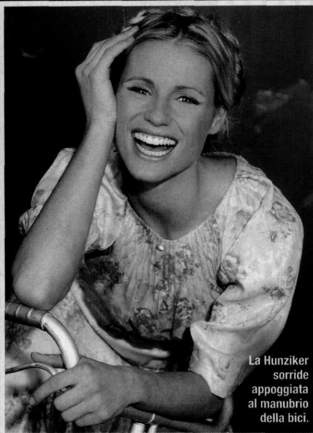
La Hunziker sorride appoggiata al manubrio della bici.