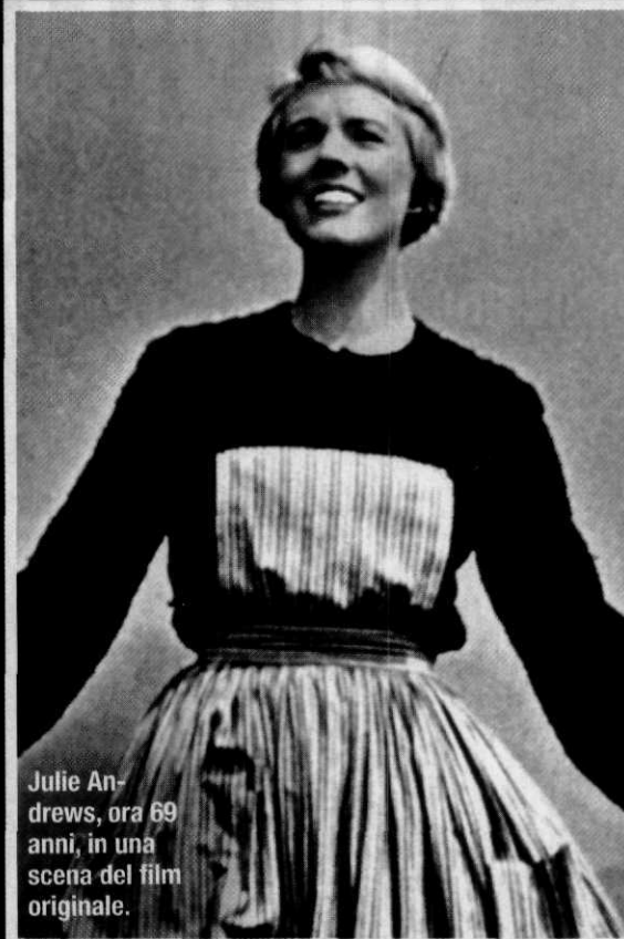
Julie Andrews, ora 69 anni, in una scena del film originale.