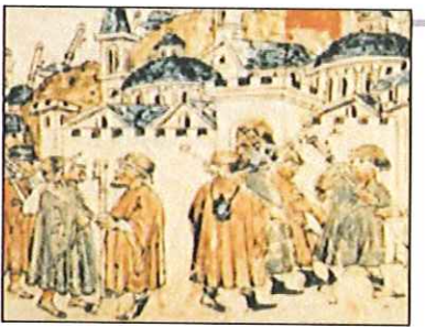
Una miniatura che rappresenta un pellegrinaggio in epoca medievale

una ventina di comuni, compreso quello di Roma), fra i posti più suggestivi ci sono: la chiesa di San Giovanni in Val di Lago, sulle rive del lago di Bolsena; San Flaviano a Montefiascone; Santa Maria in Forcella a Vetralla; la chiesa rupestre di Santa Maria del Parto, a Sutri, con affreschi che ritraggono i pellegrini della Francigena; le Torri d'Orlando, nella campagna viterbese; Sant'Eusebio a Ronciglione, con dipinti medievali; il Santuario della Ma-