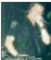
Il cantante Mike Patton

P EEPING Tom, ovvero l'anima lieve e poppeggiante di Mike Patton, è il nome della band che si esibirà questa sera al Nuovo Estragon. L'ultima volta che era passato da queste parti, l'ex leader dei Faith No More, si era presentato in compagnia dei Fantomas, formazione che (insieme a Mr Jungle e Tomahawk) rappresenta l'indole più sperimentatrice dello straordinario vocalist americano. Il concerto di oggi, è la materializzazione live di un progetto discografico che, secondo le parole dello stesso Patton, aveva l'obiettivo di "prendere tutto ciò che ho imparato nel corso degli anni e metterlo dentro il classico formato pop". Il disco, che ha tra i suoi ospiti Norah Jones, Massive Attack, Bebel Gilberto, Dan The Automator e membri dei Melvins, potrebbe essere definito di experimental-pop e riporta Patton su terreni soft, come già in passato era accaduto, quando il nostro aveva proposto una splendida versione di "Easy", un vecchio successo dei Commodores, forse il brano di maggior successo dei suoi Faith No More, scioltisi nel 1998. Il concerto sarà aperto dal Dub Trio. Inizio ore 22. Ingresso 20 euro.