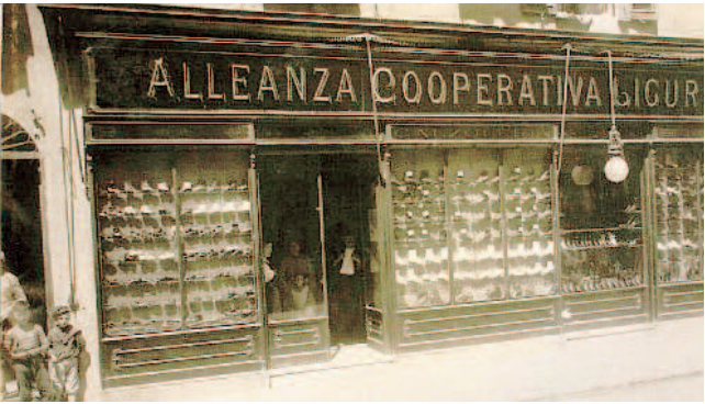
L'immagine di copertina del libro dedicato alla Liguria solidale

Un cofanetto librario e un convegno a dieci anni dalla morte