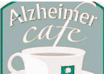
Un logo del punto d'incontro nel Centro storico