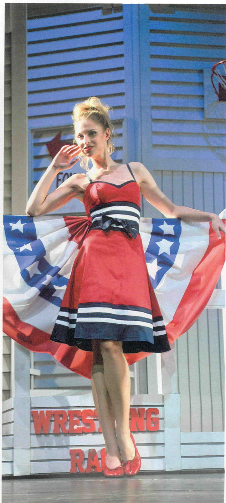
FOTO DI GRUPPO PER I PROTAGONISTI DEL MUSICAL HAPPY DAYS , IN TOURNÉE DOPO IL DEBUTTO A MILANO, DOVE LI ABBIAMO INCONTRATI. PER LA NOSTRA MODELLA, ABITO DALLA VITA STRIZZATA E A RUOTA NEI COLORI DELLA BANDIERA AMERICANA (RINASCIMENTO, 110 EURO). BALLERINE VALLEVERDE (119 EURO).