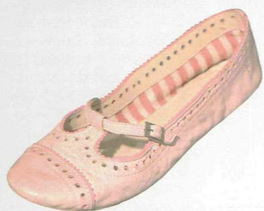
A SINISTRA: BEBÈ ROSA CON CINTURINO LES LOLITAS (79 EURO). SOTTO: BORSA STILE ANNI CINQUANTA FURLA (MODELLO FLORENCE, 105 EURO). A DESTRA: BALLERINE NERE IGI&Co (64,90 EURO).