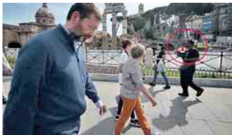
Ignazio Marino passeggia ai Fori tra gli abusivi