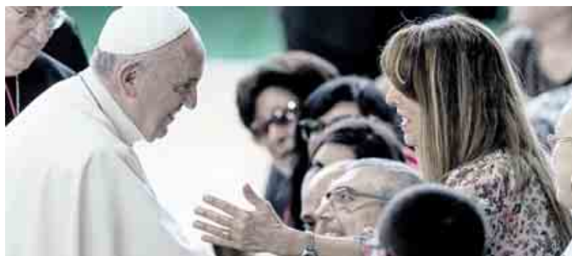
Papa Bergoglio abbraccia i fedeli nella chiesa Santa Maria Regina Pacis di Ostia

Ostia. Festa per la visita di Bergoglio alla chiesa Regina Pacis