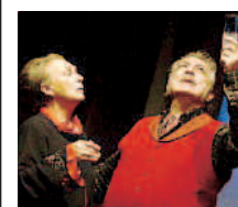
Un momento dello spettacolo al Teatro Manzoni