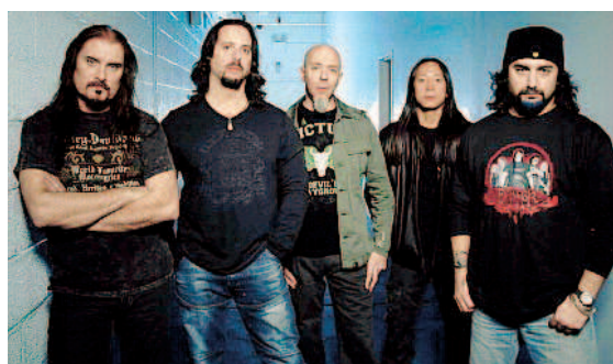
I Dream Theatre

Palalottomatica , piazzale dello Sport. Ingresso dalle ore 18. Biglietti da 40 euro. Info tel. 199128800