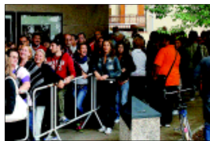
Giovani e appassionati di musical in coda per ore (Foto Anteprima)

Tutti pazzi per "Cats". Appassionati di teatro, di quelli che non si perdono mai uno spettacolo, ma anche persone che a teatro vanno una volta ogni tanto, appassionati di Cats insomma che pur di assistere al musical si sono sorbiti ore di coda fuori dal teatro. Alle 8.30 ieri mattina c'erano oltre 250 persone in fila fuori dalla biglietteria del "Giovanni da Udine". «Non ero mai riuscita a vederli Cats - ha ammesso una signora, tra le prime ad arrivare in via Trento - e questa volta non volevo proprio perdermelo, ma a quanto pare non sono la sola ad averla pensata così». In coda c'erano persone di tutte le età: giovani e meno giovani. Chi si è presentato alle biglietterie a mattinata inoltrata è rimasto allibito quando ha visto l'incredibile coda che andava fino alla strada. Per accaparrarsi un posto la gente ha aspettato per ore. «Soltanto alle 11.15 - ha detto Michela Castiglione - i responsabili